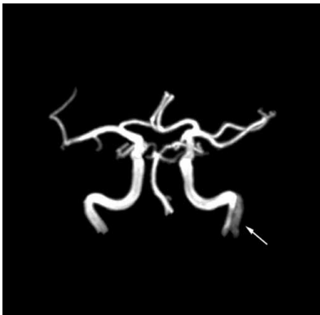
Figura 1: Imagem de angio RM com duplo lúmen (seta branca) desde o bulbo até à porção horizontal da artéria carótida interna esquerda

em relação com trombo intraluminal excêntrico” (Fig.s 1 e 2).