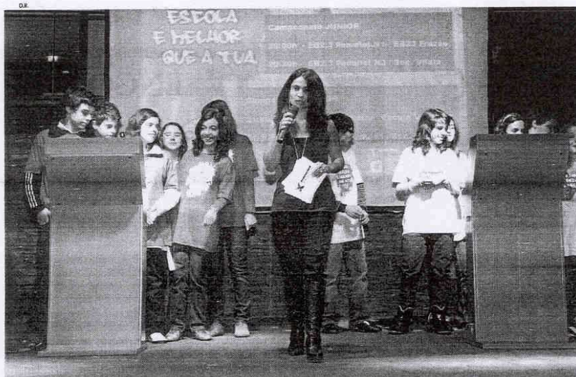
CONCURSO: Escolas animam o Ferrara Plaza

A liberdade de expressão é total, dentro dos limites legais.