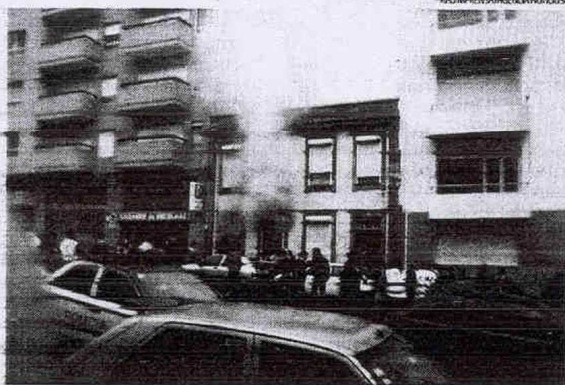
Fogo ter-se-á ficado a dever a um curto-circuito, segundo os bombeiros

Na habitação residiam seis pessoas, o casal e quatro filhos. "Ainda não sabemos quando vamos