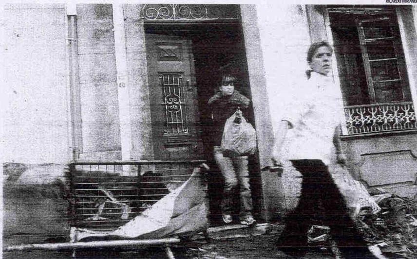
Labaredas afectaram sobretudo o rés-do-chão, onde deflagrou o incêndio